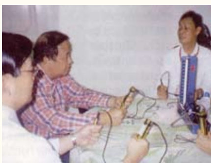
In Manila wurde die PowerTube klinisch getestet.