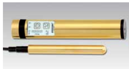
Power Tube QuickZap® vergoldet

Die Geräte werden in einem robusten Kofferchen geliefert.