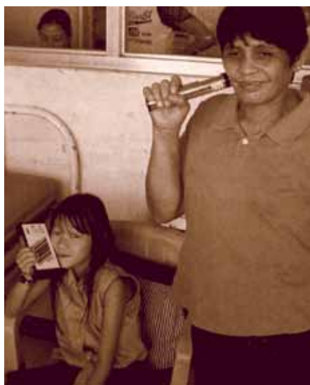
Eine Mutter und ihr Kind therapieren sich in einem Krankenhaus von Manila selbst.